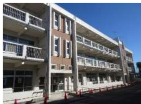
【ツートンカラーがおしゃれだと好評です】

8月からの約5か月間に及ぶ改修工事を経て、1号棟がきれいに生まれ変わりました。この間、1年生から4年生、さわやか学級の皆さんは、仮の教室で学校生活を送ってきました。色々な面で不便があったかと思いますが、その不便をうまく解消できるように、教職員も一緒になって考え、乗り切ってきました。5か月間、それまでとは違った環境下におかれたにも関わらず、それまで通り一生懸命学習に取り組むことができ、事故なく無事に過ごせたことは大変価値あることだと思います。まさに、柔軟な思考と変化への対応ができた「吉岡小学校の力（しなやかさと強さ）」です。教室の移動こそありませんでしたが、5・6年生の皆さんにも色々な影響がありました。みんなで協力した5か月間でした。引越し作業も完了し、1月からは元の教室に戻って学校生活を送ることができます。新年のスタートと同時にリニューアルされた1号棟での生活もスタートします。吉岡小学校が校舎だけでなく、気持ちも新たに令和5年を迎え、出発できるような充実した冬休みとなってほしいと思います。また、工事に携わって