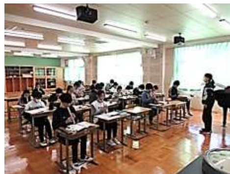
【新しくなった音楽室での授業(6年2組)】

例えば、この2号棟の特別教室は、昨年度1号棟の改修工事の期間中、2・3年生4クラスの教室となりました。改修工事前の歴史ある校舎で、教室として学習や生活をしたことは子供たちにとって貴重な経験となり、有意義なことだったと思います。新しくなった2号棟も子供たちのために積極的な活用を考えています。工事が無事に終了したことと、保護者、地域の皆様のご理解とご協力に心から感謝を申し上げます。（新）校舎の完成を報告させていただきます。